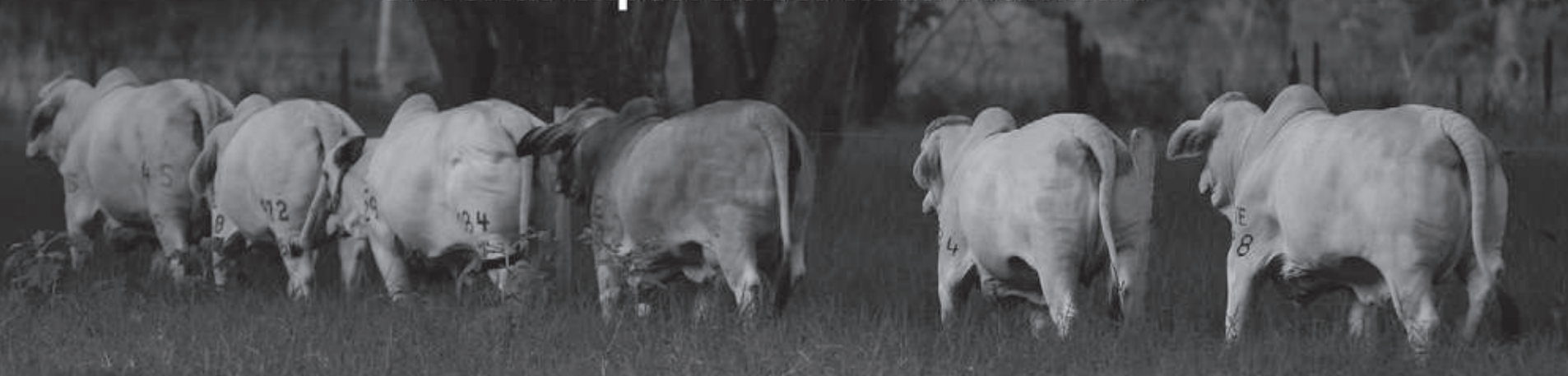
LÍMITES DE PESO POR COMPETENCIA MACHOS(Kg)